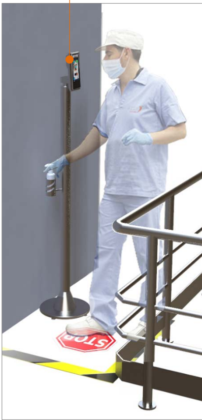
OPCIÓ DESINFECTANT MANUAL