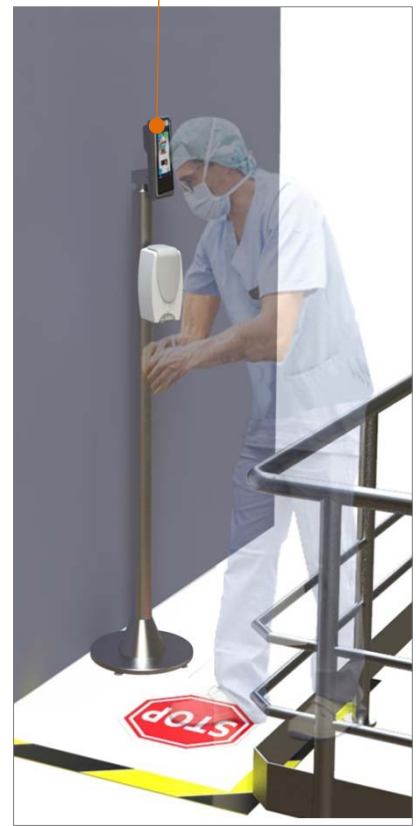
OPCIÓ DESINFECTANT AUTOMÀTIC